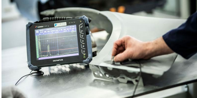
Figure 4(c) / Rajah 4(c)

Rajah 4(c) menunjukkan peralatan untuk pengujian tanpa musnah. Pengujian ini dilakukan ke atas keluli dan bahan logam yang lain untuk mengesan kecacatan dalaman bahan.