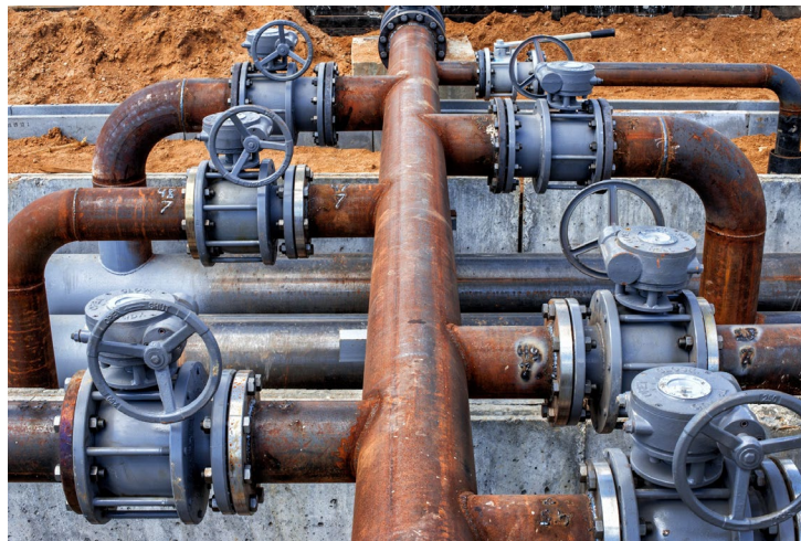
Figure 4(b)/ Rajah 4(b)

Rajah 4(b) menunjukkan kakisan yang merosakkan saluran paip di industri.