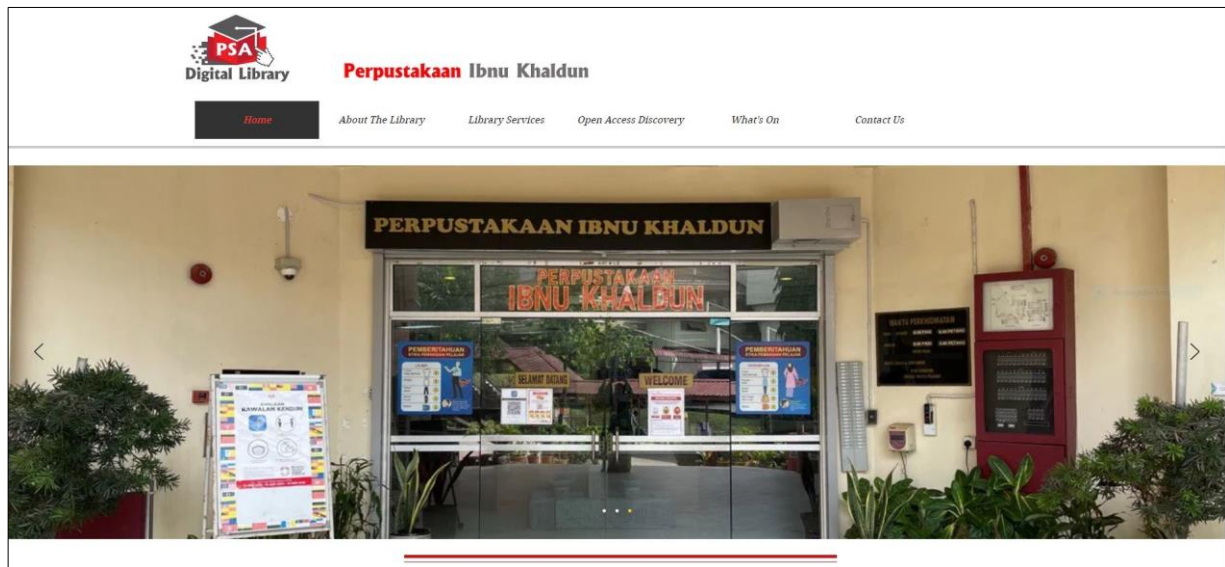
Rajah 2: Muka Hadapan Portal PSA Digital Library

Selari dengan visi PSA untuk menjadi peneraju TVET yang unggul, Perpustakaan PSA berhasrat untuk menjadi peneraju pendigitalan bahan rujukan TVET di Malaysia. Bagi memudahkan capaian maklumat oleh pengguna, Perpustakaan telah membina website PSA Digital Library yang boleh diakses menerusi komputer dan telefon bimbit dan membangunkan aplikasi PSA Digital Library yang hanya boleh diakses melalui telefon android. Menerusi portal ini pengguna boleh membuat carian setempat mengenai perkhidmatan yang ditawarkan secara dalam talian oleh Perpustakaan dan maklumat Institutional Repository PSA. Bagi mempromosikan portal ini kepada semua warga PSA, pelancaran telah dibuat semasa Majlis Perhimpunan Bulanan PSA pada 5 Mac 2021. Portal ini telah dibangunkan menggunakan perisian sumber terbuka iaitu aplikasi Wix.