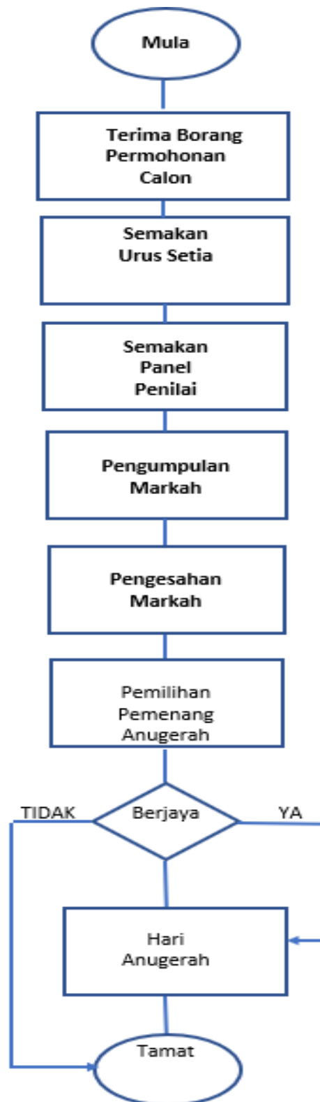
Carta Alir Proses Pelaksanaan Anugerah Kecemerlangan Staf PSA

Proses Pelaksanaan Anugerah Kecemerlangan Staf PSA adalah seperti Carta Alir berikut: