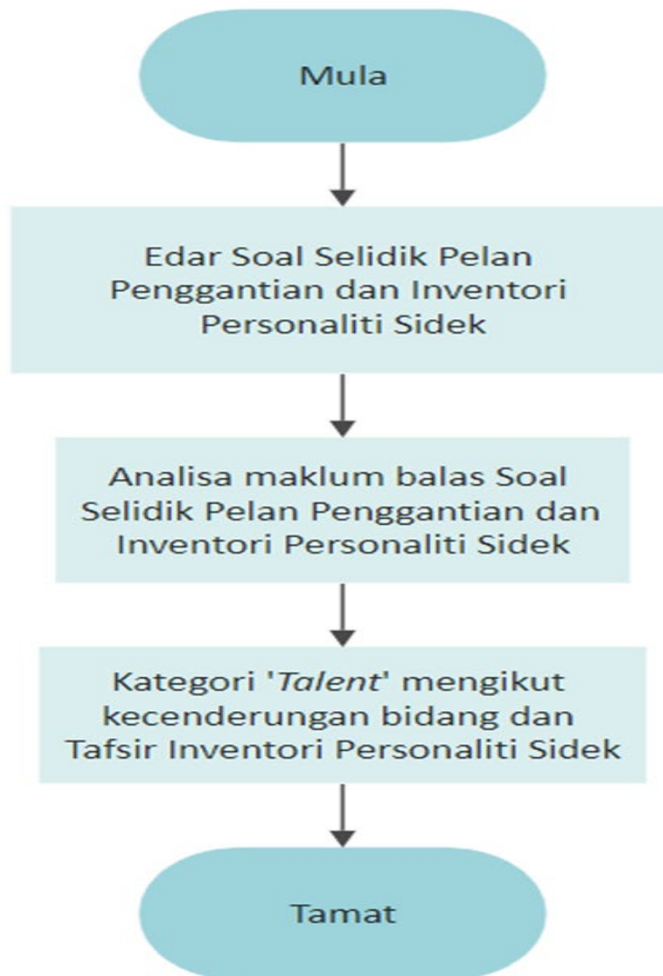
Carta Alir Pemilihan Kelompok Bakat

Carta alir pemilihan kelompok bakat adalah seperti di bawah.