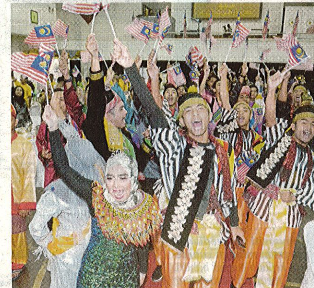
Peserta mengibarkan Jalur Gemilang sambil menyanyikan lagu patriotik pada Majlis Penutup Festival Kebudayaan dan Semarak Merdeka 2018 di PSA, Shah Alam.

"Kami mengambil masa selama lima minggu untuk sesi latihan yang dibimbing oleh pasukan dikir barat di Kota Kinabalu iaitu Qirat Laksamana dan ternyata komitmen daripada pelajar membuahkan hasil membanggakan apabila dipilih sebagai juara keseluruhan dan memenangi empat lagi anugerah dalam pertandingan dikir barat kali ini," katanya.