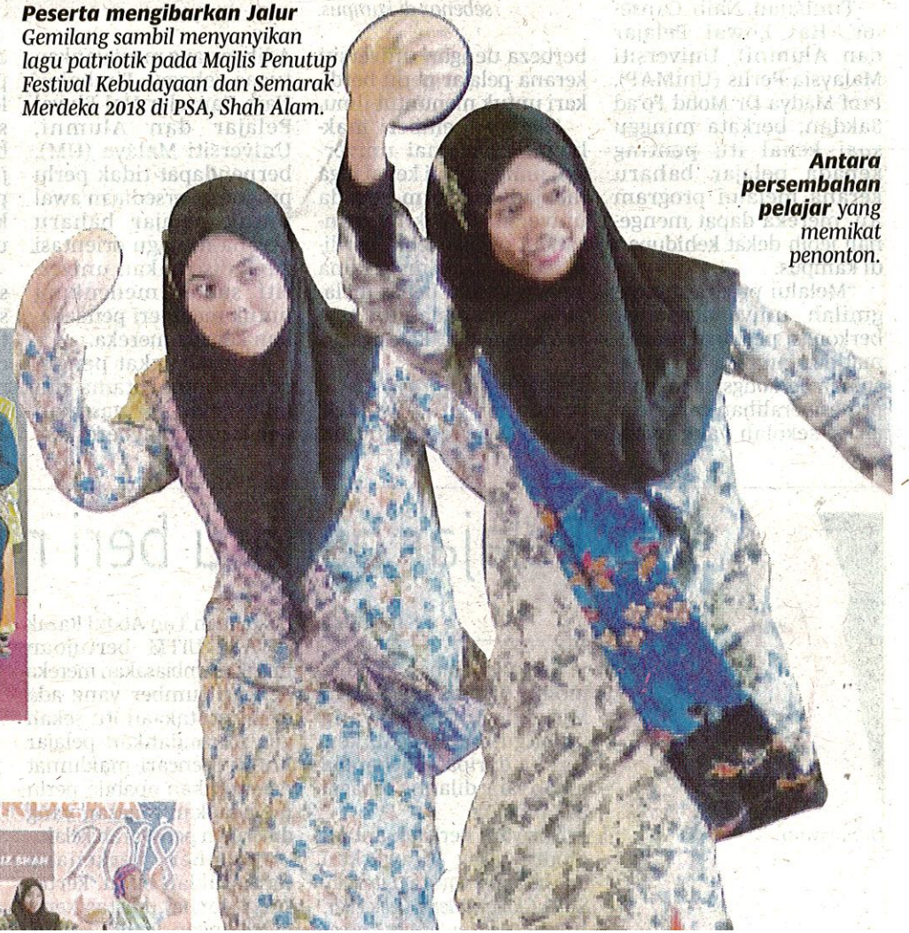
Antara persembahan pelajar yang memikat penonton.