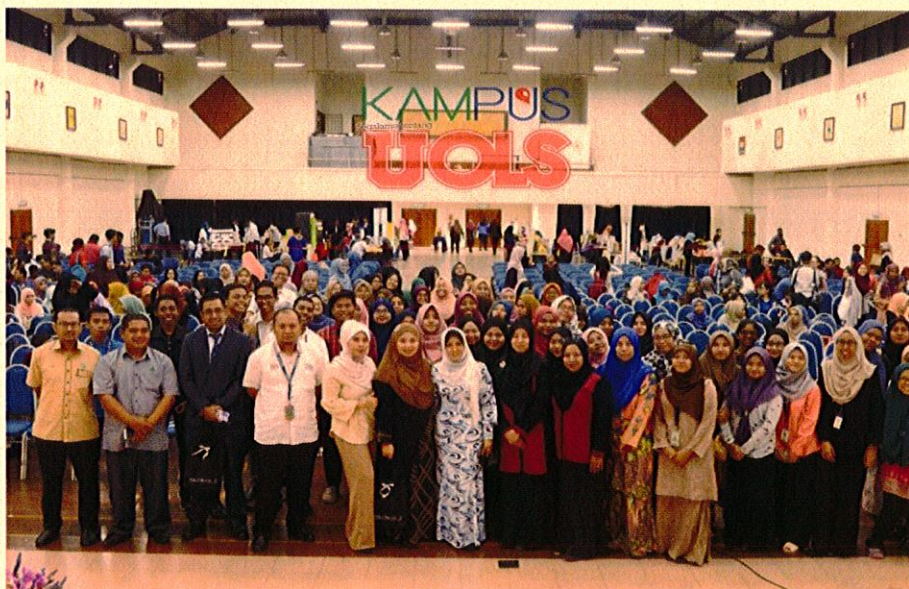
Pihak pengurusan dan penuntut PSA bergambar kenangan selesai tamat program

Kumpulan yang berjaya akan diberikan insentif keusahawanan yang membolehkan mereka aplikasikan sebagai perniagaan baharu serta menjadikan keusahawanan sebagai kerjaya pilihan selepas menamatkan pengajian.